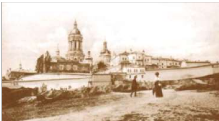
Уже в післясковородинівському столітті невідомий фотограф утілює для нас Києво-Печерську лавру. Листівка. Кінець XIX ст.

Дата народження Григорія Сковороди стала відома через 200 років, коли перекладач знайшов у листі згадку про святкування його 41 дня народження. І досі це є унікальне свідчення та підтвердження дати народження філософа.