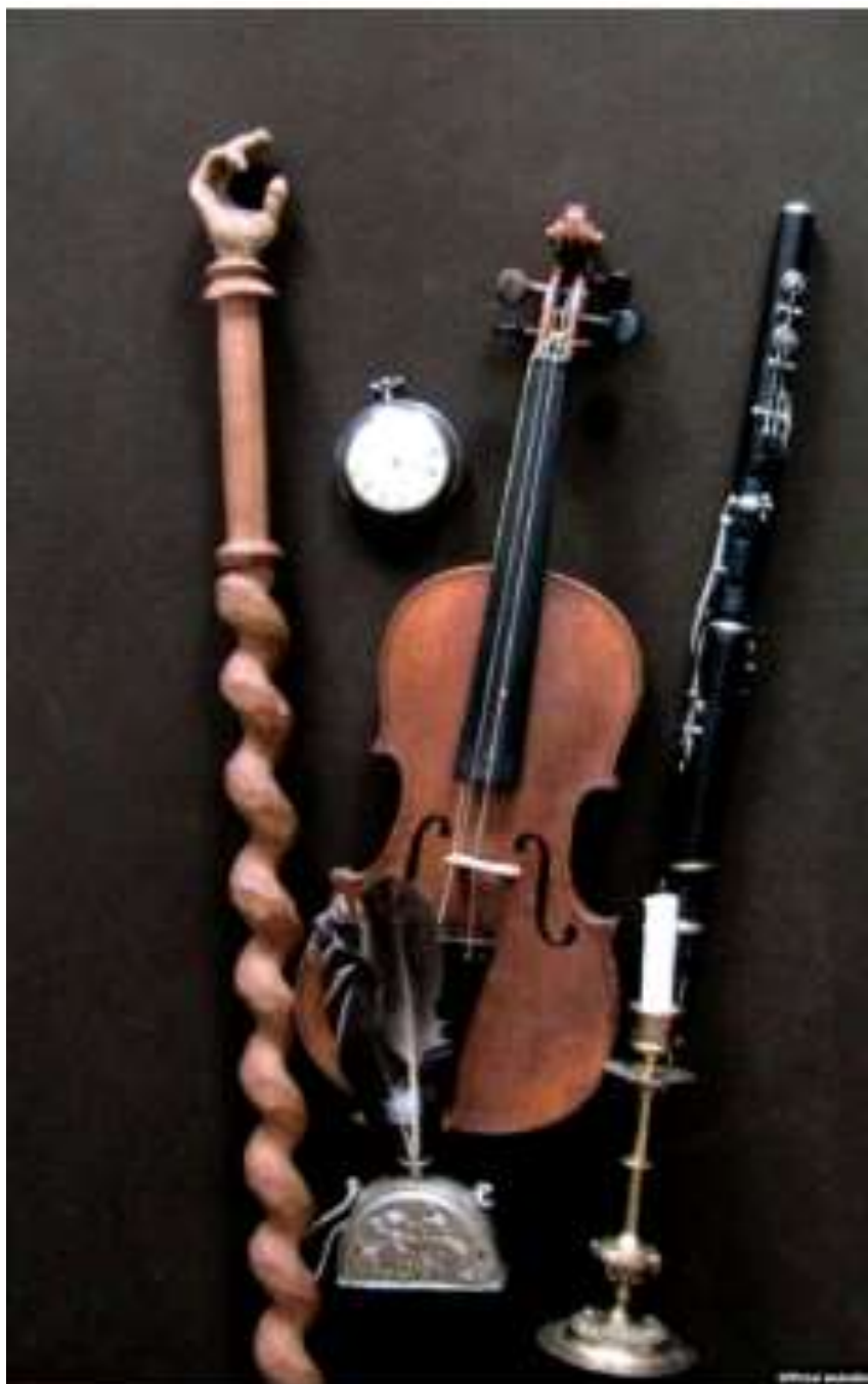
Речі Григорія Сковороди