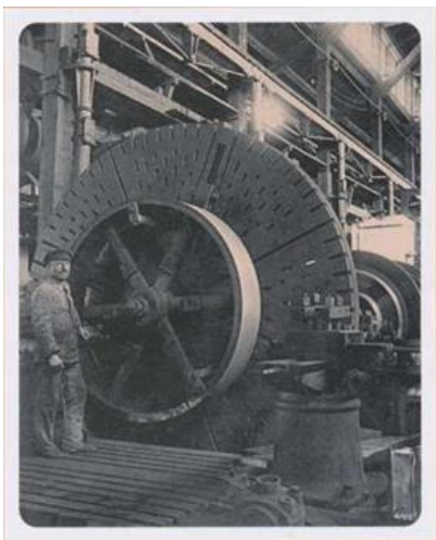
Механічний цех, 1916 рік

Після приходу до влади більшовиків акціонерне товариство було оголошено власністю держави. У 1918 р., під час німецько-австрійської окупації, завод було зруйновано і пограбовано (звісно, не без участі місцевого населення). Було вивезено найкраще обладнання, зникли запаси сировини, більшість господарських книг загинула у вогні. Підприємство відновило діяльність лише 1922 році і спочатку випускало плуги, нескладний сільгоспінвентар тощо.