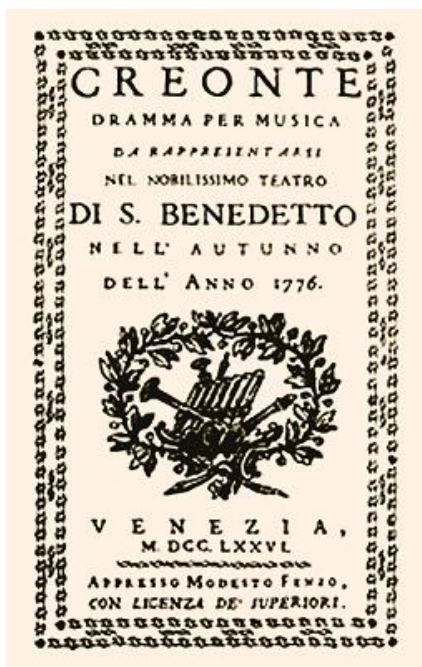
Титул надрукованого лібрето опери «Креонт», поставленої у Венеції, у театрі Сан-Бенедетто в 1776 р.

Наполегливе навчання Дмитра Бортнянського в Італії тривало