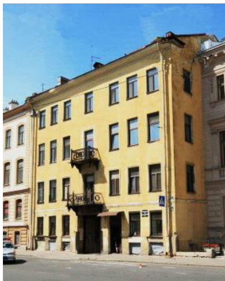
Будинок Бортнянського у Петербурзі на вул. Мільйонній, 9А (сучасний вигляд)

Одинадцятирічний італійський період для молодого композитора був досить плідним — написано твори для солістів, оркестру, хору (деякі з них збереглися до нашого часу). У них автор органічно використовував українську мелодику, мотивно-інтонаційні та ритмічні звороти, що надавало музиці особливого колориту і подобалось італійцям. Як визначний композитор того часу Дмитро