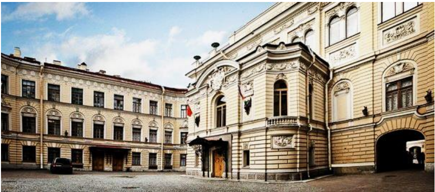
Будинок Співочої капели в Санкт-Петербурзі.

Очолити Придворну капелу, де колись починав звичайним півчим, Дмитро Степанович поставив собі за мету вивести її на вищий рівень. Задля цього він свідомо знизив свою композиторську активність. Новий капельмейстер домогся збільшення складу з 24 вокалістів до 60, поліпшення фінансового забезпечення капеланів та звільнення Капели від оперних спектаклів. Також вдалося значно зменшити участь у виснажливих придворних церемоніях. Це дало можливість зосередитися на роботі з підвищення виконавської майстерності і перейти лише до співу a capella (без музичного супроводу). У результаті Бортнянський створив унікальний вокальний