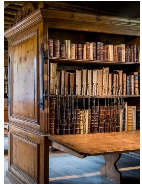
Бібліотека ім. Уімборна