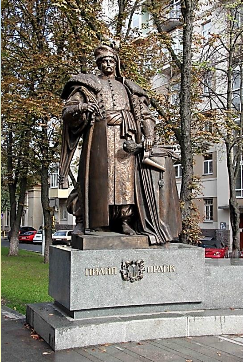
Пам'ятник Пилипу Орлику, Київ