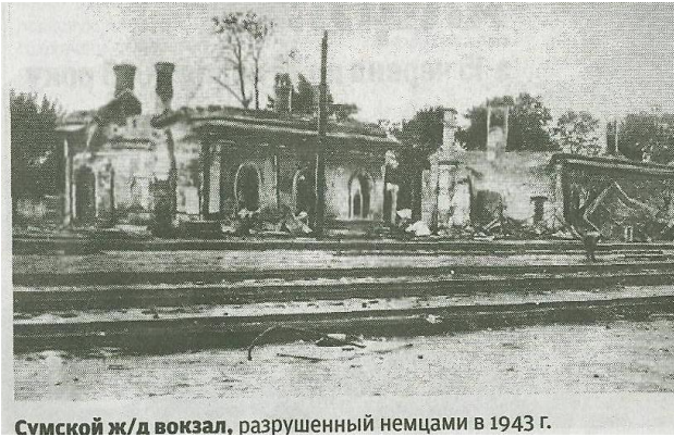
Сумской ж/д вокзал, разрушенный немцами в 1943 г.

спалено 128 сіл і частково – 635 населених пунктів, 36,6 тис. дворів колгоспників, 420 підприємств (80 %), 37 залізничних вузлів і станцій, кілька депо.