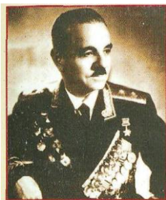
Командир 50-го стрілецького корпусу С. С. Мартиросян

Почесне звання "Почесний громадянин міста Суми" присвоєно воїнам-визволителям С.С. Мартиросяну, І. І. Мельникову та Л.М.Протопопову.