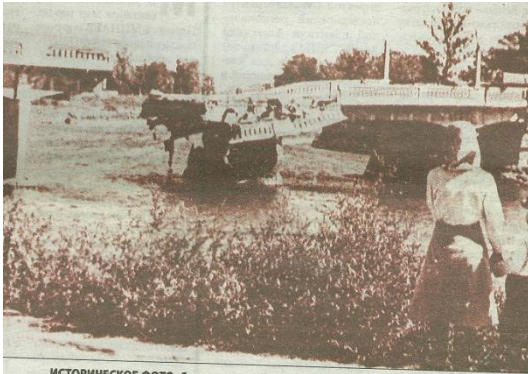
ИСТОРИЧЕСКОЕ ФОТО. Солдаты выполнили свой долг. Взорванный Харьковский мост через р.Псел, Сумы, 1943 г.

Справді, місто звільняли частини 38-ї армії, їх зустрічали люди, їх імена й потрібно увічнити. Дивізії, що звільнили Суми,