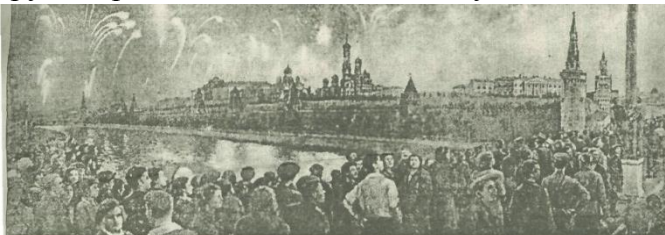
Когда-то День освобождения Сум праздновали не только в нашем городе. На фото из газеты "Известия" от 3 сентября 1943 года - салют в Москве "в честь доблестных войск Красной Армии, освободивших город Сумы от немецких захватчиков".

В газеті «Известия» від 3 вересня 1943 року було фото – салют в Москві «в честь доблесних військ