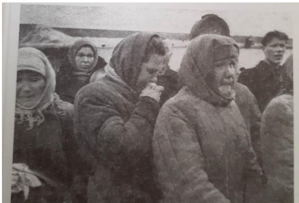
Так одевались наши женщины в годы войны

«В августе 1941 года во дворе заставляли рыть щели. Уже часто бомбили. [...] в памяти – в Дом вбегает мама в военной форме – гимнастерке и сапогах и кричит: «Что же вы сидите, собирайтесь, берите зимнее пальто, серебро, белье и бегите на станцию, госпиталь уже отъезжает!» Мамина областная больница была превращена в эвакогоспиталь и мы с бабушкой (отец был на фронте) эвакуировались вместе со служащими в товарных вагонах.