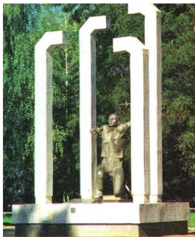
Суми. Пам'ятник жертвам фашистських концтаборів. Фото. 2003

Багато з них померли від голоду, були розстріляні. За школою над урвищем знаходився пустир з їхніми братськими могилами».