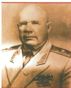
Командир 167-ї стрілецької дивізії І. І. Мельников