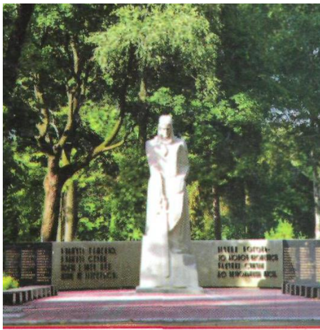
Суми. Пам'ятник воїнам Радянської Армії. Фото. 2003

Братські могили з великою кількістю похованих воїнів є на Центральному кладовищі (73), Лучанському (112), Баранівському (26) та інших кладовищах. Пам'ять про всіх похованих увічнена спорудженими на їх могилах пам'ятниками, серед них 3 скульптури, 8 обелісків, 2 стели. В даному посібнику є фото і опис пам'ятників бойової слави.