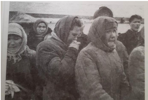
Так одевались наши женщины в годы войны

«В августе 1941 года во дворе заставляли рыть щели. Уже часто бомбили. [...] в памяти – в Дом вбегает мама в военной форме – гимнастерке и сапогах и кричит: «Что же вы сидите, собирайтесь, берите зимнее пальто, серебро, белье и бегите на станцию, госпиталь уже отъезжает!» Мамина областная больница была превращена в эвакогоспиталь и мы с бабушкой (отец был на фронте) эвакуировались вместе со служащими в товарных вагонах.