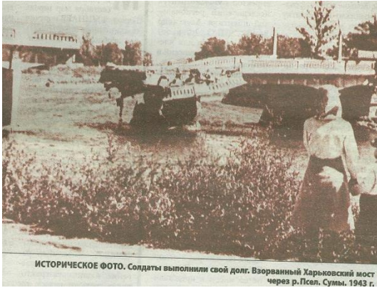
ИСТОРИЧЕСКОЕ ФОТО. Солдаты выполнили свой долг. Взорванный Харьковский мост через р.Псел, Сумы, 1943 г.

Справді, місто звільняли частини 38-ї армії, їх зустрічали люди, їх імена й потрібно увічнити. Дивізії, що звільнили Суми,